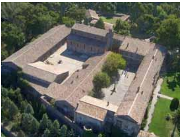
Castello di Maniace, Ducea di Nelson Via Santa Maria di Maniace, Bronte (CT)