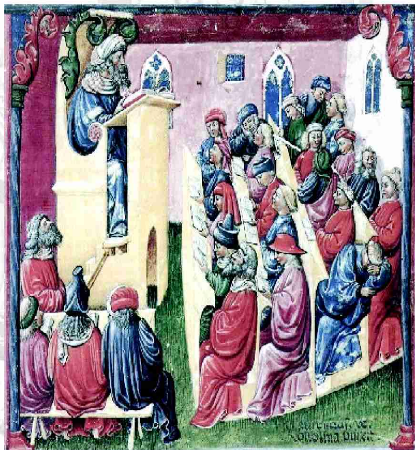
A painting of a university classroom c. 1350 by Laurentius de Voltolina