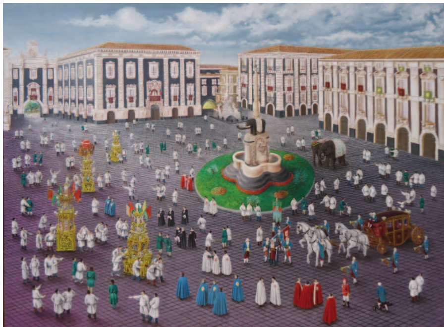
Gigliuto, Il Piano di Sant'Agata , per gentile concessione dell'autore.